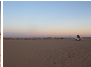
Sonnenuntergang in der Wüste

Tag 6 Toshka – Sedenga Tempel – Gebel Dosha (Sehenswürdigkeiten) - Soleb Tempel – Sesibi Tempel – 3. Katarakt – Sebu-Petroglyphen Besichtigung der Tempel von Sedenga, Soleb, Sesibi und der Sehenswürdigkeiten von Gebel Dosha (West-Seite), Überfahrt über den Nil in Delgo (Fähre), Besichtigung des 3. Katarakts Mittagessen Picknick beim 3. Katarakt Besichtigung der Sebu-Petroglyphen Abendessen und Übernachtung im Camp in Sebu