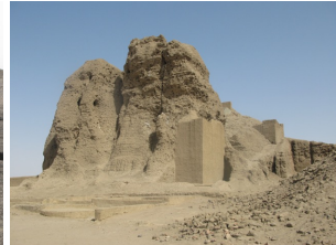
Western Deffufa (Kerma)