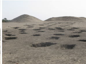
Bei der Eastern Deffufa (Kerma)