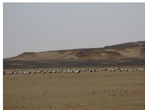
Störche in der Wüste