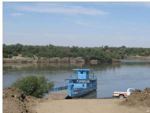
Fähre über den Nil

Tag 5 Abri – Toshka – Wüste Überfahrt über den Nil (Fähre), Fahrt nach Toshka Mittagessen Picknick in Toshka Wüstentour Abendessen und Übernachtung im Wüstencamp