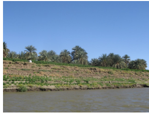
Landwirtschaft am Nil