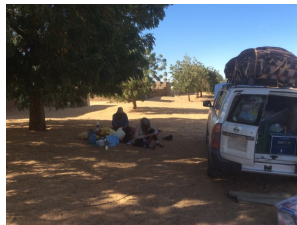
Picknick in Toshka