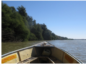
Bootsfahrt auf dem Nil

Tag 4 Abri - Amara West (Sehenswürdigkeiten) – Sai-Insel (Sehenswürdigkeiten) – Abri Besuch der Sehenswürdigkeiten von Amara West und der Sai-Insel mit dem Boot (ganzer Tag) Mittagessen Picknick Abendessen und Übernachtung im Magzoub Hostel