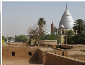
Khalifa-Haus & Mahdi-Grab