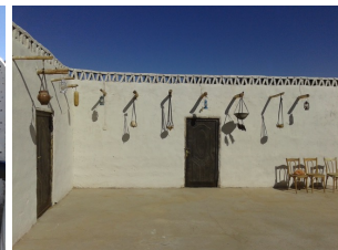
Im Magzoub Hostel

*Es wird empfohlen, das Programm an einem Freitag zu beginnen (und entsprechend an einem Montag zu beenden).