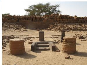
Königliche Stadt von Meroe