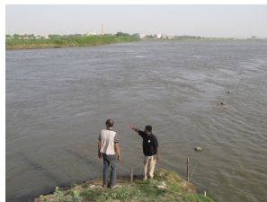
Zusammenfluss des Nils