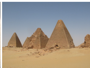
Pyramiden bei Gebel Barkal